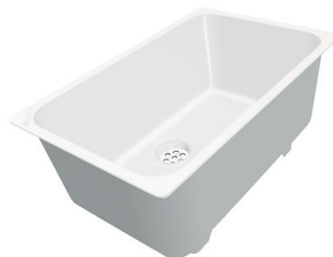
Weißer Wanne 8153 100

* nur in Kombination mit dem Zubehör 8644 101